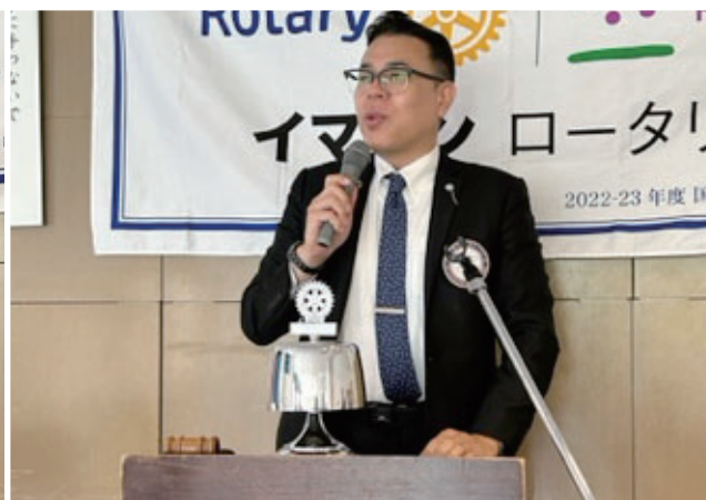
卓話 三須会長エレクト