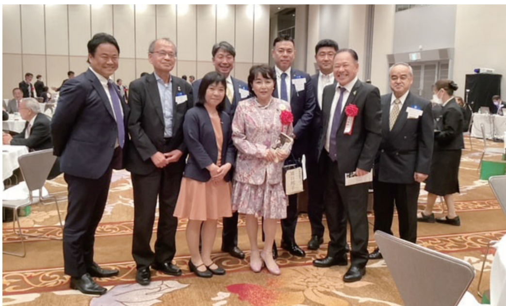
鎌ヶ谷 RC50 周年記念式典出席